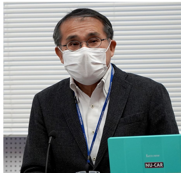
開会挨拶 見坐地 副センター長